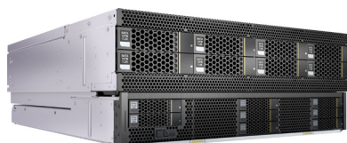
全宽异构计算节点

FusionServer Pro G5500具有高密的异构计算能力，支持丰富的异构拓扑配置和一键切换，支持CPU和异构计算技术的长期演进。FusionServer Pro G5500适合为AI、HPC、智能云、视频分析和数据库等应用加速，是面向数据中心大规模部署的最佳异构计算平台。