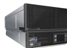
半宽异构计算节点